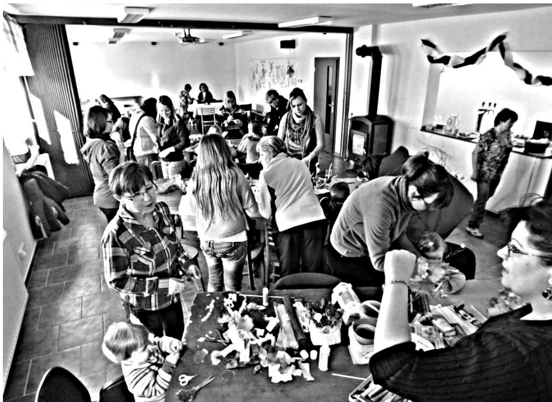
Foto: tvořivé odpoledne